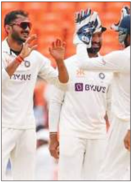
ऑस्ट्रेलिया के खिलाफ विकेट लेने के बाद जश्न मनाते हुए भारतीय खिलाड़ी।