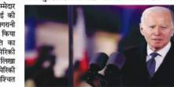
करना चाहते हैं कि उनकी बैंकों में जमा रकम सुरक्षित है और उन्हें जब भी इसकी जरूरत होगी, वह इसे निकाल सकते हैं। अमेरिका की वित्तीय संस्थाओं और वित्त विभाग ने भी एक संयुक्त बयान जारी कर कहा है कि लोगों का बैंकों में जमा पैसा सुरक्षित है और वह उसे निकाल सकते हैं। अमेरिका के फेडरल रिजर्व विभाग ने एलान किया है कि वह बैंकों की मदद के लिए अतिरिक्त फंडिंग करेंगे ताकि लोगों को किसी तरह की परेशानी ना उठनी पड़े। देश के बैंकिंग सिस्टम में लोगों का विश्वास बनाए रखने और अमेरिकी अर्थव्यवस्था को मजबूत रखने के लिए

वाशिंगटन। अमेरिका के सिगनेचर बैंक और सिलिकॉन वैली बैंक डूबने की खबरें पूरी दुनिया की सुर्खियां बनी हुई हैं। अब इसे लेकर अमेरिका के राष्ट्रपति जो बाइडेन का बड़ा बयान सामने आया है। जो बाइडेन ने ट्वीट करते हुए कहा कि बैंकों के डूबने के लिए जो लोग भी जिम्मेदार हैं, उनके खिलाफ कड़ी कार्रवाई की जाएगी। जो बाइडेन ने दोनों बैंकों के खाताधारकों को भी बड़ी राहत दी और