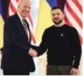
राष्ट्रपति की सुरक्षा, कीव में दौरा की व्यवस्था और भोजन की तैयारी के लिए आवंटित की गई थी। इसके अलावा एक अलग खर्च आम नागरिकों की भीड़ को जटाने और अमेरिका व यूक्रेन के बीच मौजूद दोस्ती के बारे में बताने के लिए था। बाइडेन ने यूक्रेन के लिए 500 मिलियन डॉलर की अतिरिक्त सहायता

करदाताओं को 1.6 मिलियन डॉलर से अधिक का नुकसान हुआ है। यह पैसा अमेरिकी